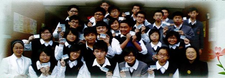
【高三同學簽署守貞卡】

透過貞潔教育課程教導兩性交往的目的，以及兩性應有的尊重，告知學生未婚懷孕將面臨的後果，得以防範於未然。謹守拒絕婚前性行為，保持婚後忠誠，追求健康的人生。邀請學生自由決定是否簽下「守貞許諾卡」，使同學了解守護珍貴的自己與將來的家庭與子女，需要慎重地做出許諾的抉擇。