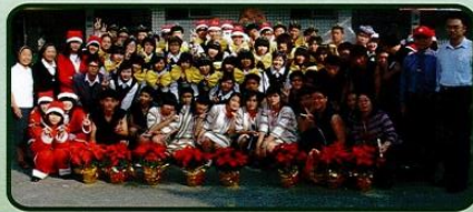
【校外報佳音洋溢溫馨】