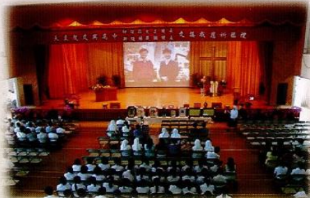
【新卸任校長交接典禮盛況】

謝謝主教、董事長、莊校長和縣內所有中小學校長、嘉賓，師長同學參與此一盛會，祝福大家喜樂平安！心想事成，幸福滿滿！