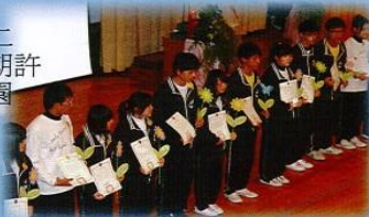
【第三屆微笑禮儀親善天使誕生】

由全校各班推舉67名微笑禮儀典範。經由全校師生參與網路投票甄選出禮貌天使、微笑天使、氣質天使、服儀天使、熱忱天使共十二名，十二位天使就像十二顆種子，期許十二顆微笑禮儀的種子，撒播到校園每一個角落，相信每一位同學都會是微笑禮儀天使，用最真誠的微笑與愛的行動，把生命中的真善美串聯起來。