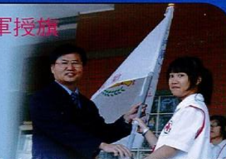
【紅十字青少年服務隊授旗儀式】

文興高中本學期成立「文興紅十字青少年服務隊」，加強對全校同學意外傷害的預防與急救之訓練，以期將此觀念與技術拓展至整個校園，並能影響社會大眾，俾使意外傷害所造成之損失降至最低為宗旨。