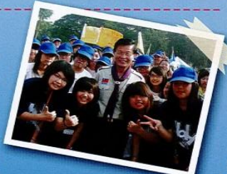
【HOLY童軍與趙守博主委合影】

本校HOLY童軍團10月22-24三日參加彰化縣童軍大露營；全員表現優良，共獲晨間檢查、追蹤旅行、大地遊戲闖關、生活紀律等25面榮譽錦旗；另獲得、最佳生活紀律獎、晚會最佳演出獎、最佳團隊默契獎、最佳晚會氣氛營造獎、團隊精神總錦標等獎項。