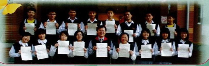
【校長帶領文興師生響應反墮胎簽署】

天主教家庭與人權協會發起在今年12月10日聯合國大會中提出生命是從「受精到自然死亡」的定義，即含尚未出生胎兒的人權等四項詮釋「人權宣言」中第3條、第16條、第25條與第26條，以反制由墮胎的激進團體於同日訴請聯合國對「人權宣言」的詮釋不同，而推動墮胎全球合法化的議案，文興高中本著尊重生命的宗旨，全校師生積極響應聯合國反墮胎連署活動。