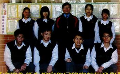
【文興心語心得寫作同學與校長合影】

聽完了校長所說的這一席話後，真的是令我感觸很深，因為一個人的習慣好、壞，所形成的個性是決定一生命運的重要因素，如果一個人的習慣不好，那麼就更別說他的個性，甚至是他的做事，處理事情的態度。反之，如果一個人的生活處事是很完善的，那麼想必他的習慣也是好的，校長所說過的：「播種思想，收穫行為；播種行為，收穫習慣；播種習慣，收穫個性；播種個性，收穫命運。」這席話真的很有道理，也讓我收穫很多，讓我了解播種的特別意義，真的是非常感謝校長對我們大家的關懷與勉勵，因為校長所說的這一席話，點醒了我，讓我也了解到好的習慣和堅持是邁向成功之路。