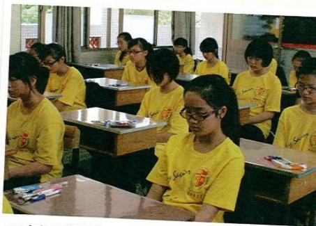
配合無鐘學制度，新生也要入境隨俗——課前靜坐。

國中和國小判若雲泥，課業壓力明顯加重許多，雖然現在我是新鮮人，但未來我會跟隨著師長們的步伐，慢慢成長，和這溫馨文興一起快樂度過國中生涯。