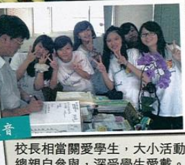
校長相當關愛學生，大小活動總親自參與，深受學生愛戴。

三、 自己要成為溫暖照耀的明燈 ：生命經由不斷的學習修煉，長養愛心、知見和智慧，讓自己成為一個有能力的人，當我們有能力，就要去愛人、幫助人、關心人，為他人服務。所謂：「己立立人，己達人。」一個微笑，一句問候讚美，一個關懷支持，都是一盞燈，能照亮他人的容顏，照亮他人前進的路。不斷的學習與超越，讓自己成為溫暖照耀他人的光，是生命最高的價值。