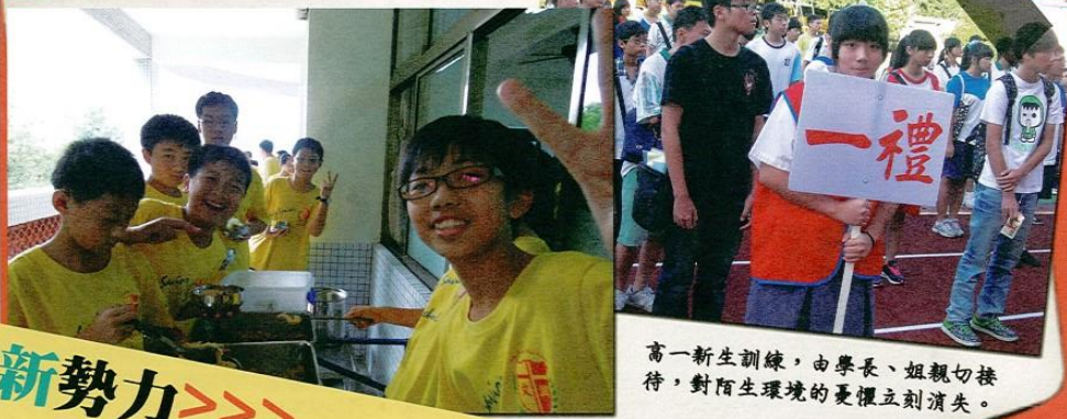
高一新生訓練，由學長、姐親切接待，對陌生環境的憂懼立刻消失。