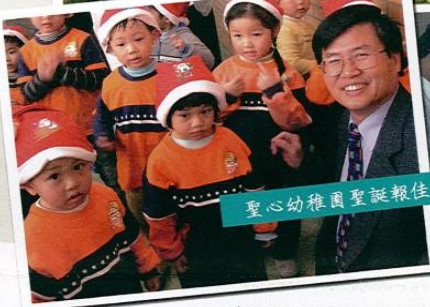
聖心幼稚園聖誕報佳音