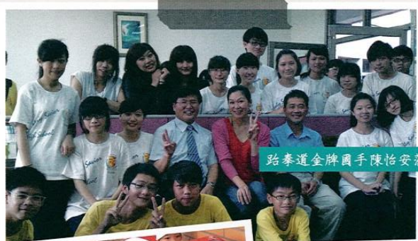
跆拳道金牌選手陳怡安蒞校演說

二、 言行要朝向良善正大的道路 ：我們的一言一行，都是透過學習而讓它變得更加美好，透過智慧的追尋，而讓它變得更加良善。聖經箴言說：「在一切之上，你要謹守你的心，因為生命由此而生。」(箴言四：23)我想：「做小事，常是做大事的開端；做好事，常是做好人的源頭。」生命的最佳準則便是：「勿以惡小而為之，勿以善小而不為。」如同聖經上說：「為此，你應走善人的道路，持守義人的行徑，因為只有正直的人纔能住在地上，只有成全的人方得在那裡居留。但是作惡的人必由地上剷除，違法的人必由其中拔除。」(箴言二：20)