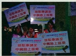
文興志工犧牲連假時間協助維持大會秩序，習得寶貴經驗。