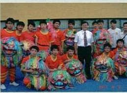
文興舞獅隊參與舞動百年全運，挑戰3971隻獅頭，創金氏紀錄。