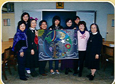
(教師心靈成長心靈彩繪曼陀羅)

97學年上學期輔導室成立「曼陀羅心靈彩繪--教師心靈成長團體」，每週2小時，進行六週，共計12小時。本校教師讀書會行之有年，為讓參加教師能體會不同的團體成長方式，特別舉辦教師心靈成長團體，並運用曼陀羅心靈彩繪方式進行，體驗創作的喜樂，並於創作中享受與自己相遇的特別感受。