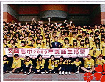
(美語生活營大合照)

本校在寒假期間辦理為期一週的「高二美語生活營」，在活動期間營造全美語環境。經由美語村的外籍教師，熱情的活動設計與帶領之下，不用出國也能體會到國際地球村的重要。