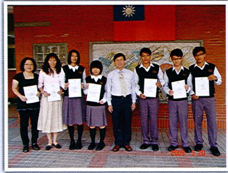
教育部策略聯盟計畫「地方產業與文化之數位內容建置專題競賽」榮獲第一名