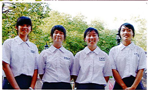
(大學四技繁星四顆星)