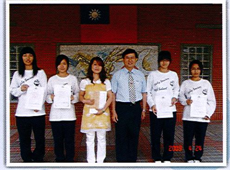
策略聯盟計畫「觀光行程設計創意專題製作決賽」榮獲第一名

●本校98年應屆畢業生商資學程計164人，在校期間參加會計事務、電腦軟體應用及網頁設計丙級檢定成績優異，計有160人通過檢定，通過率達98%。其中獲一項丙級檢定合格者有29人，獲二項丙級檢定合格者有44人，獲三項丙級檢定合格者有87人，其中有16人同時通過丙級三項及乙級電腦軟體應用檢定合格。 ●97學年度寒假優良課外讀物閱讀心得寫作比賽，共計特優8篇，優等24篇，佳作84篇。特別感謝本校國文老師的協助，優等以上之作品置於學校網頁，與大家一起來分享。 ( http://www.hshs.chc.edu.tw:8080/dept/lib/ )