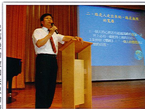
(校長演講專注神情)

這場專題演講，讓我們深刻感受到生涯規劃的重要性，校長精采的講解也讓我深刻感受到自己的不足與該改進的地方，這場演講將成為我人生重要的轉折點之一，校長說的不錯，「人生路，關關難過關關過，處處難行處處行」。當我們遇到困難，還不是一天二十四個小時的在度過，再崎嶇的路還是有人走，再高的山還是有人爬，再難的考試還是有人考榜首，只要願意付出努力，這並非是不可能的事情，畢竟，世上本無路，人走多了，便成路了。