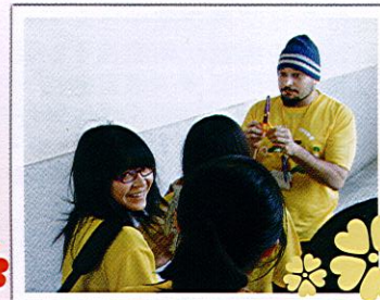
(外國美語生活營外師教學生動活潑)