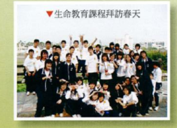
▼生命教育課程拜訪春天