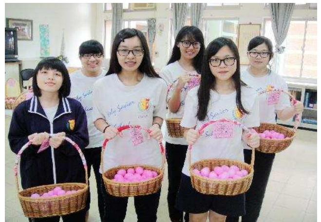
耶穌復活節-分享彩蛋活動