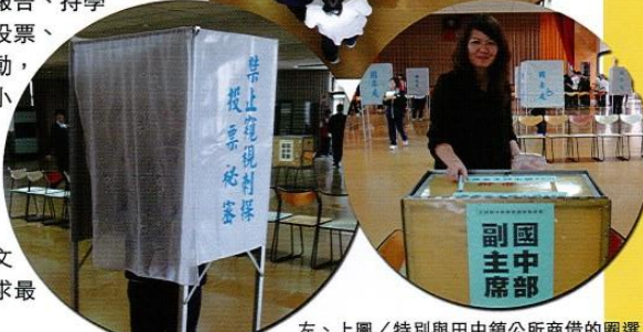
左、上圖／特別與田中鎮公所商借的圍選區遮屏與票區，讓同學投起票來身歷其境。