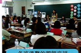
各班溫馨的親師座談