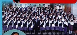
上／校長、學務主任與微笑天使們合影。 左／校長是第100號微笑天使參選員。