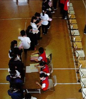
左圖／投票踴躍，參與熱誠百分百。

文／一忠 邱鈺倫 許均雅 蔡雅婷、二義 黃惠君 文興歷來力行學生自治活動，於今年十一月進行了「班聯會正副主席的選舉」，包含政見報告、持學生證領取選票、投票、開票等一系列活動，彷彿學校就是個小小的社會。而我們得以以選票選賢與能，讓班聯會代表全體同學，整合意見，為文興全體師生，謀求最大的福利。