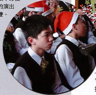
上、左圖／99年聖歌比賽於12月旬落幕。各班花招盡出，歌聲動聽扮相新奇，臺下觀眾看得目不暇給。