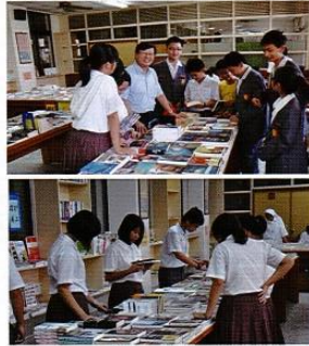
上圖／「悅」讀書展於10月在教學資源中心閱覽室展出，學校已依師生推薦優良書籍採購36450萬元之優良圖書歡迎借閱。

文興高中辦理書展已擁有多年的歷史，今年由華禹文化出版社辦理此項業務，推出一系列優良出版品，加上今年新加入多媒體製作學程，此次以藝術類書籍為主軸，輔以生命教育、身心成長、電腦繪圖類書籍為輔，希能推廣全校師生四大類書籍的閱讀並開闊視野。