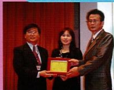
家長委員授證與致禮