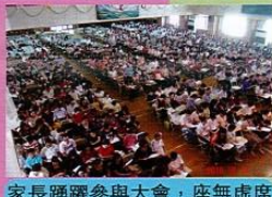
家長踴躍參與大會，座無虛席