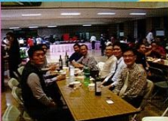
家長委員餐敘大會愉悅溫馨