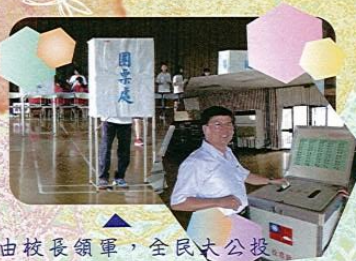
由校長領軍，全民大公投

而選舉的結果，必定有輸有贏，但不管輸贏，我們想，每個人都必須坦然接受最後的結果，並且為新的候選人，送上最高的祝福以及最熱烈的掌聲。因為最終最大的勝利，是自主權和新希望結合的文興新風貌。