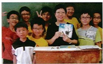
▲容光煥發的幸君老師