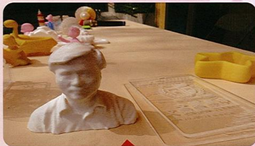
用雷射製成的文興歷克力，和校長獨特的雕像

3D列印的運用範圍非常廣泛，在建築方面，已經有人藉其在極地建造冰屋。也有人認為此項科技能在火星上直接蓋房子，而非靠著太空接運送微量的材料。在醫療方面則是一件創舉，身體上的缺陷能藉由3D列印，彌補不完全的缺角。以一位失去手指的病患為例，他能利