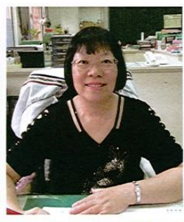
▼樂於與學生分享生命經驗的老師

在抗癌期間，老師也寫了許多文章，除了抒發自己內心的感嘆，也將當下的歡笑與淚水轉變成文字，記錄下來，成為永恆。老師曾經參加過希望基金會所舉辦的徵文比賽，獲得了全國第二名，老師將其獎金捐給文興圖書館，鼓勵學生多閱讀。還有將投稿稿費捐出去，幫助更多癌友，也因此認識了許多朋友，大家互相扶持、互相鼓勵，一起對抗病魔。