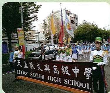
為校爭光的文興儀隊、樂隊

穿上儀隊表演服，伴隨著代表文興儀隊的榮譽，我們開始踩街表演活動。這一次表演所展現的槍法稍難，過程中手很酸痛，一開始總會忐忑不安，擔心自己是否會做錯槍法，但沿途聽見身旁伙伴們共同喊著口號，隊伍旁行人的加油聲與掌聲，讓我抬頭挺胸享受一切氣氛與表演。為了這一刻練習再累也都值得！在結束踩街走回會場時，竟然會有意猶未盡的感覺，感謝學校讓我們有機會體驗踩街，感謝那些我們共同走過的回憶與曾經。