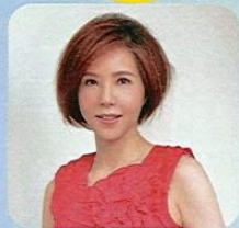
優雅大方的雅芳學姊