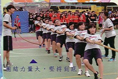
團結力量大，堅持到底

要成功，對手很重要，對手可能是一個人，一件事，一個逆境，強的對手能激發你的潛力。 *文興心語*