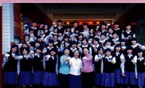
上圖／高三學生貞潔教育後合影。 報導節錄自2009/11/25自由時報

吳姓女學生說，她很認同貞潔卡觀念，這很像國外父母為女兒戴上守護貞潔的戒指，每當自己被愛情迷昏頭，一時衝動時，看到戒指就想到爸媽，這張卡會跟隨著她到大學。