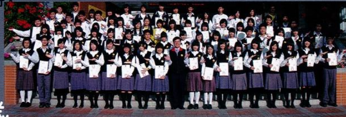
上圖／100名微笑天使徵選活動

相信這些微笑禮儀天使們在校園的生活裡，能潛移默化週遭的人、事、物，將微笑散播在校園的每一個角落，進而帶動校內學子們的團結與友愛，更進一步培養出屬於文興人的優美、優雅、優質、優秀、優越的風度言行。