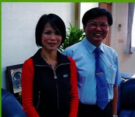
右圖／鍾教授與校長合影

鍾怡雯女士係享譽文壇的著名女作家。今年10月26日的午后，我們有幸邀約到鍾教授蒞臨文興講演，與師生分享「散文的閱讀與寫作」一題。鍾教授以個人創作經驗分享，言談幽默詼諧，充滿對生活的觀察與感思，整場為時二小時的演講毫無冷場。