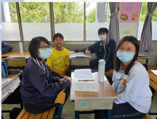
國防部兵役課代表