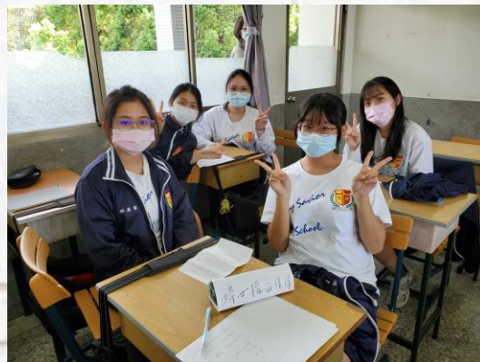
婦女保障協會代表