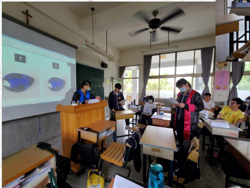
校園模擬法庭——珠寶竊盜案