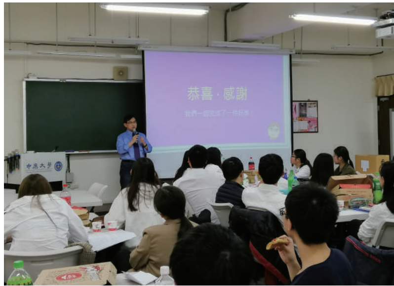
▲ 吳老師期望能讓同學除了在課程體驗企業營運模式外，也能運用專業一起完成一件好事！

每一次的服務經歷，都有不同體悟，這些體悟擴及的影響難能可貴，看見更多人一起投入這塊領域，帶領學生思考專業能做些什麼服務，是吳老師持續推動服務學習教育最大的動力。訪談尾聲，老師也鼓勵大家能在專業上，思考如何和社會結合，貫徹以自身具備的專業去回饋社會。