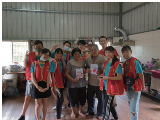
▲ 長者收到暖心卡片與志工共同露出幸福的笑容