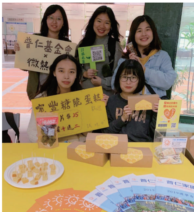
▲ 義賣過程，學生們絞盡腦汁思考行銷策略，期望能以專業達成服務目標。

因此，若能讓學生以自身專業與非營利組織夥伴合作，既能提供行銷上的支持，又能讓學生們走出校園、看見社會需要。於此同時，專業與服務的齒輪，已接連扣上，以服務為中心的企業概論課程，因而誕生。