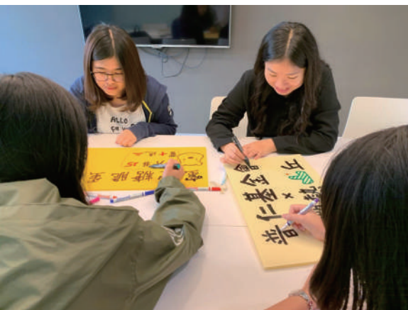
▲ 每組同學都用心的製作義賣宣傳海報