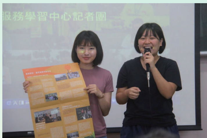
▲ 詠庭及育恩在記者團招募說明會中，與學弟妹分享獲取的收穫及成長