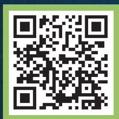
中原大學 服務學習中心 官網