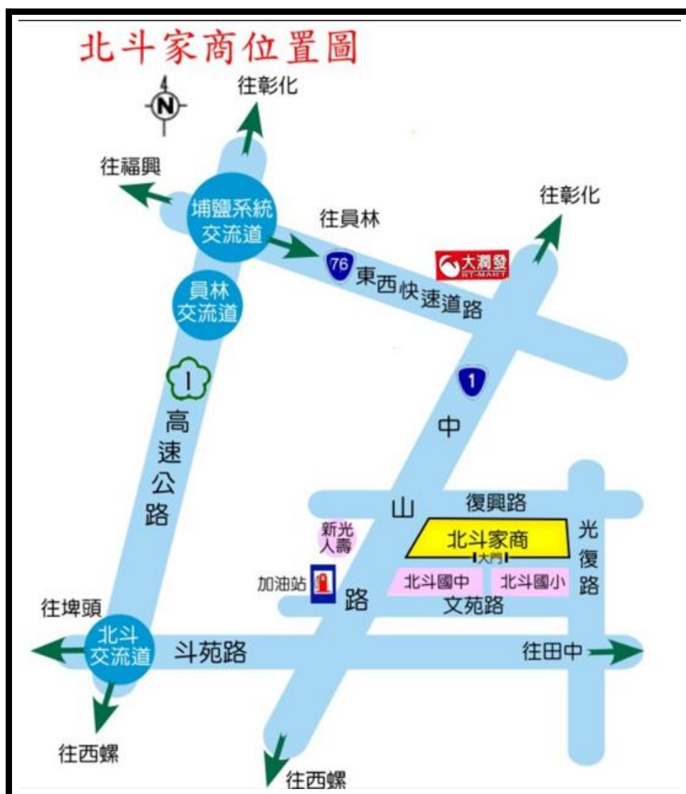
附圖一 承辦學校位置圖