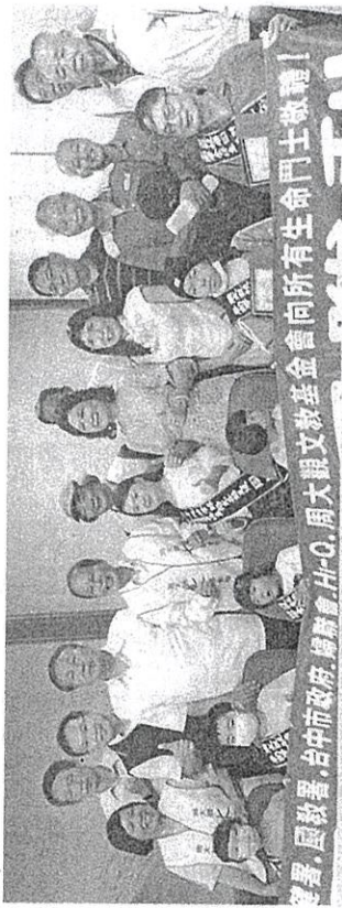
▲周大觀文教基金會昨天在臺中市政府陽明大樓，頒發生命鬥士獎章給臺中市的六名得主。

周大觀文教基金會昨天在臺中市政府頒發「生命鬥士獎章」給臺中市的六名得主。該基金會今年從臺灣各縣市和港澳地區共選出三百多名抗癌鬥士，並頒發每人兩萬元獎學金，鼓勵他們勇敢抗癌的精神。為避免抗癌鬥士奔波，基金會採取在各縣市頒獎，或多個縣市得獎者一起頒獎的模式，下個月將在臺北市頒獎給屏東、花蓮、臺東的得主。