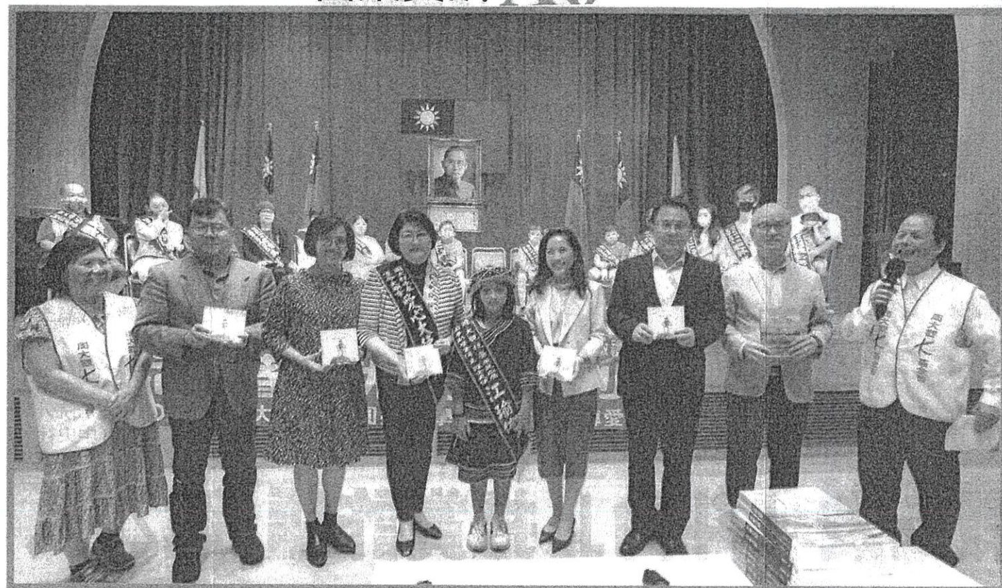
↑周大觀基金會15日邀請15位熱愛生命獎抗癌小鬥士受獎，同時邀請媒體、企業一同為大家加油打氣。