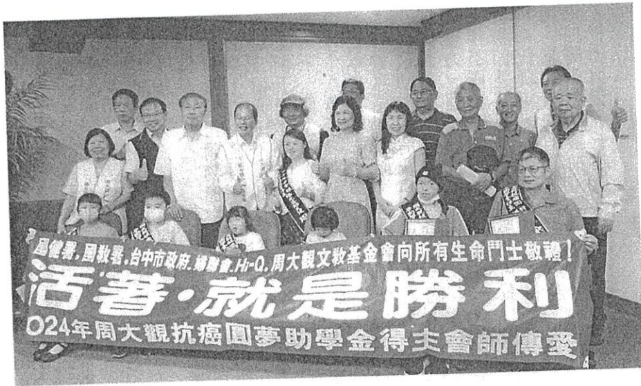
↑周大觀文教基金會頒發助學金給六位抗癌勇士。